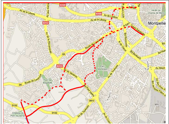
Vue générale des itinéraires et des variantes (en trait plein, les pistes cyclables).

Le deuxième itinéraire quitte la Route de Lavérune à gauche par l'avenue Croix du Capitaine, puis (deuxième à droite) la rue de Fontcouverte que l'on suit jusqu'à l'avenue de Vanières/Bd Paul Valéry, en face du stade de rugby. Il n'y a pas de voie cyclable, mais la rue Fontcouverte est assez tranquille. Traverser l'avenue, et continuer en face le long du parking du stade. Il y a un large trottoir partagé. On est dans le nouveau quartier Ovalie, rue de Bugarel. Après 600m, prendre à gauche un chemin vaguement goudronné (Mas de Jaumes), qui tourne tout de suite à droite, devient un chemin de terre, genre chemin creux sous les chênes verts, et descend vers le Rieucoulon. Après, ça redevient une petite route goudronnée, qualifiée de piste cyclable par de grands panneaux de jalonnement, passe sous la RD132 et atteint le chai du Terral au bout de 1km.