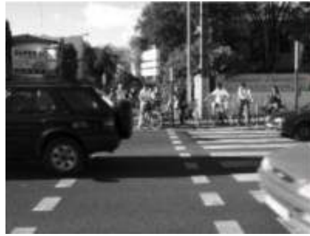
La traversée du carrefour au début de la route de Nîmes : pas facile !